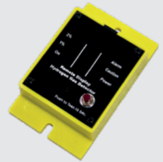
Boîtier de commande